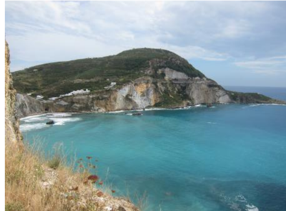
La isla de Ponza

Zannone y Gave al noroeste y la isla de Ventotene y Santo Stefano al suroeste. Además, a unas 6 millas al suroeste de la isla de Ponza, se yergue solitario sobre el mar el escollo de la isla Botte.