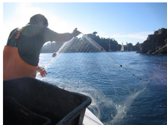
Pesca artesanal con trasmallo

Así, en las Islas Pontinas, destaca la pesca artesanal y en la época de primavera/verano, domina la pesca con redes de enmalle y palangre de fondo ( Merluccius merluccius , Lepidopus caudatus , Mullus surmuletus , Spicara smaris ), seguido por el cerco ( Engraulis encrasicolus ) y el trasmallo (especies objetivo Sepia officinalis , Scorpaena sp , Palinurus elephas ).