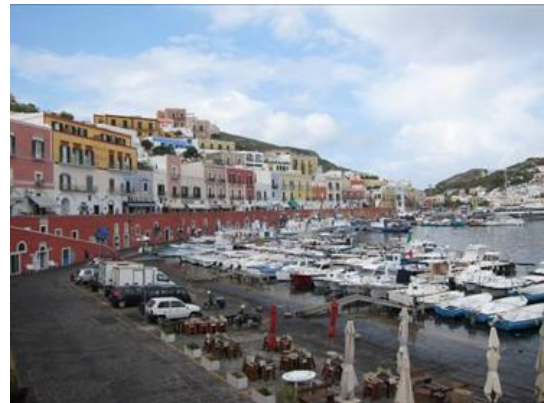
Puerto principal de la Isla de Ponza

La flota pesquera operativa de Ponza es de 36 barcos: 2 barcos de arrastre que faenan desde finales de primavera a verano capturando exclusivamente gambas rojas ( Aristeomorpha foliacea y Aristeus antennatus ), 2 barcos que operan con redes de cerco para la captura de anchoa ( Engraulis encrasicolus ), 20 barcos artesanales (eslora <12 m) que trabajan con diversos artes de pesca en base a las especies objetivo de cada temporada, 12 barcos polivalentes (eslora > 12 m) que trabajan con redes fijas, principalmente en verano para la captura de pez espada ( Xiphias gladius ). En el centro de la isla también hay otro pequeño puerto llamado Le Forna, donde la actividad pesquera suele ser nula y predominan las embarcaciones recreativas.